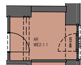
Abstellraum im 1.OG

HAUS Mönchgut, Aufgang 2 Wohnung 2-1.2 | 10G